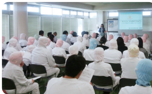
コンプライアンス巡回勉強会

役員・全従業員を対象にしたコンプライアンス勉強会を毎年実施しています。また、2016年度より新たに勉強会のフォローアップとして、コンプライアンス違反の事例を用いた理解度確認テストを毎月行っています。様々な取り組みを通し、一人ひとりのコンプライアンス意識の醸成と定着に努めています。