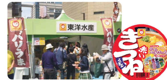
「博多どんたく港まつり」の東洋水産ブースと「仙台七夕まつり」特別パッケージ商品

地域社会への貢献のために、全国の様々なお祭りに協賛しています。また、会場にブースを設けたり、実施に合わせてお祭りのロゴと象徴的な写真を配置した商品を発売するなどの応援を行っています。2017年度は「博多どんたく港まつり」や「仙台七夕まつり」など13ヶ所のお祭りに協賛しました。