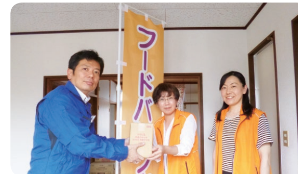
フードバンク山口への商品提供

(株)シマヤでは、企業等から提供された食品を、生活困窮者や児童養護施設等に供給するフードバンク活動に賛同し、2016年度より商品提供を実施しています。この活動を通じて、流通上の都合等で品質に問題がないにもかかわらず廃棄される食品ロスと、それに伴う環境負荷を削減するとともに、地域社会への貢献を行っています。