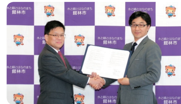
館林市との締結式の様子

2018年2月5日に、関東工場の所在地である館林市と、「災害時における物資供給に関する協定書」を締結しました。また、2018年3月26日に北海道事業部の所在地である小樽市と、地域における幅広い分野での連携と協力に関する「パートナーシップ協定」を締結しました。今後も地域とのつながりを大切にしていきます。