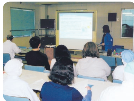
コンプライアンス勉強会の様子

法務部では、一人ひとりのコンプライアンス意識の醸成と定着のため、毎年上半期に役員・全社員を対象に、各事業所にて「コンプライアンス勉強会」を実施しています。下半期にはフォローアップとしてコンプライアンス違反事例の紹介や勉強会の理解度確認テストを行っています。また、階層別集合研修時にもコンプライアンス教育を行い、すべての社員が公正で誠実な判断のもと業務に励めるように取り組んでいます。