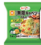
パリパリ無限 キャベツのもと 1食入