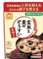
玄米と麦のぞうすい 豆入り