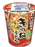
うまいつゆ 塩分オフ きつねうどん

健康寿命延伸への貢献を目的とした商品の提供を行っています。減塩、無添加や機能性表示食品の他、野菜や玄米・麦・雑穀といった素材などの各種栄養機能に着目し、さまざまな消費者ニーズ、売場展開に対応する健康を意識した商品群の開発、販売を行っています。また、超高齢化社会を見据え、東洋水産グループが長年こだわってきた水産素材やだしの分野などの強みも活かした、食の楽しみと健康につながる商品を拡充していきます。