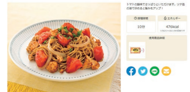
オリジナルレシピサイト

WEB オリジナルレシピサイト https://www.maruchan.co.jp/recipe/