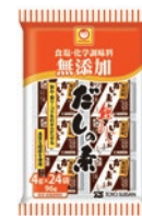
だし素 鰹あじ 無添加 96gトレー入り