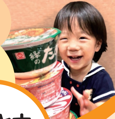
東洋水産グループ の商品の前に笑顔