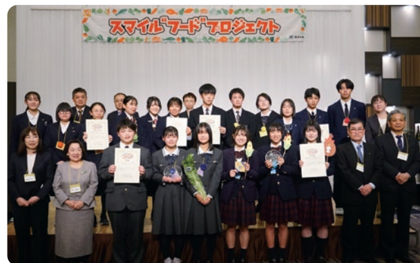
2023年度決勝大会の様子

供への取り組みを地域の皆さまや次世代の社会を担う子どもたちに知っていただく機会となっています。