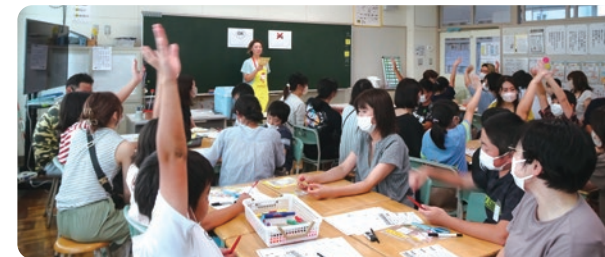
八戸の小中学校での出張授業の様子

各事業所では近隣の児童・生徒を対象に、食育や環境に関する出張授業や工場見学会を行っています。八戸東洋(株)と東北支店では2015年度から八戸市内の小中学校を対象としてFDスープに関する出張授業を行っています。2023年度は、合計10校544人が参加しました。本出張授業ではバーチャル工場見学やFDの特性を学んでいただく授業の他、自分の好きな具材を入れたオリジナルFDスープづくりを行っています。