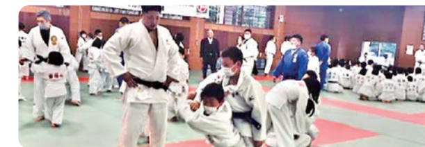
マルちゃん少年柔道教室の様子

1986年より「マルちゃん杯少年柔道大会」を開催しています。また2022年度からは「マルちゃん少年柔道教室」を全国で展開し、2023年度は8会場で延べ1,600人以上の子どもたちが参加しました。海外でも柔道・剣道の大会や教室を開催しています。メキシコでは「マルちゃん少年少女柔道大会」「マルちゃん少年少女剣道大会」を実施しています。