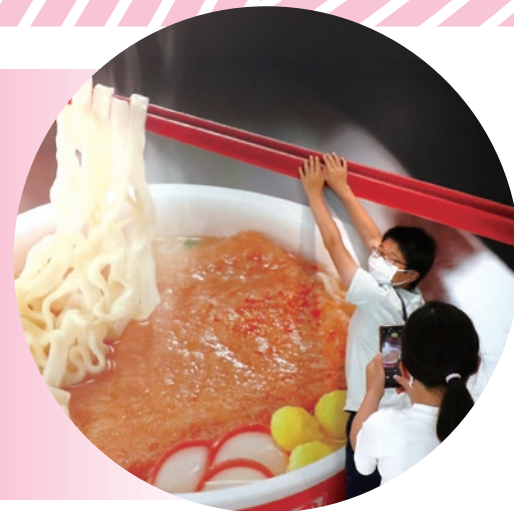
関西工場での親子工場見学会の様子