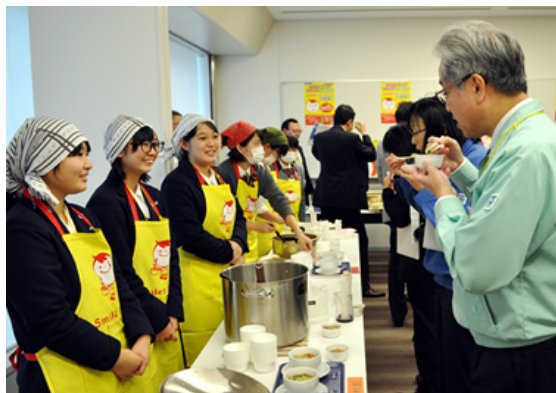
2015年～2019年 決勝大会の様子

※2020年度のコンテストは、 青森県・岩手県・宮城県・秋田県・山形県・福島県の教育委員会より後援 をいただいております。