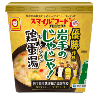
2019年優勝作品 2020年10月に東北地区 限定で発売予定