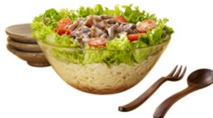
冷し中華 DE 「豚しゃぶサラダ」