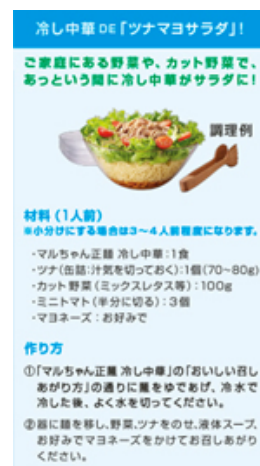
レシピ掲載イメージ