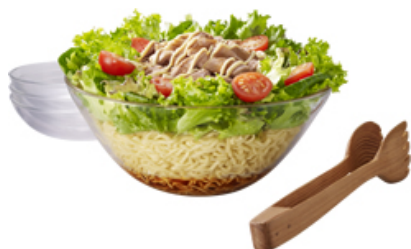
冷し中華 DE 「ツナマヨサラダ」