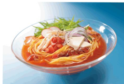
【冷製ラーメン調理例】