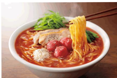
【温かいラーメン調理例】

この度の商品は、コシとしなやかさが特長の中太麺と、トマトペーストをベースに、たまねぎ、香味野菜をバランス良くブレンドしたスープがマッチします。「温かいラーメン」「冷製ラーメン」どちらでもおいしく召し上がれるよう、スープの希釈量、麺のゆで時間を調節し、トマトの程良い酸味でさっぱりとした味わいに仕上げました。