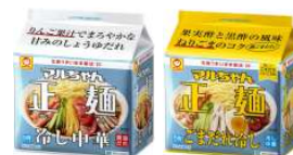
「3 月 16 日 リニューアル発売」

2011 年の発売以降、同シリーズでは 30 フレーバー以上を発売するとともに、リニューアルを重ねて参りました。これからも、季節や流行に合わせた商品展開を通じて、更なる価値の提供に努めて参ります。