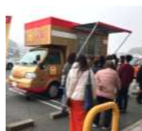
「キッチンカーの様子」

幅広い世代の皆様に愛され続ける商品を目指し、人気コンテンツとのコラボレーション企画や、消費者キャンペーンの実施、キッチンカーでの試食提供等を通して、新たな食シーンのご提案やシリーズの認知拡大を図って参りました。近年では、ABC クッキングスタジオと共催で「子どもレシピコンテスト」等を実施し、お子様も一緒に楽しめる企画で商品の魅力をアピールしています。