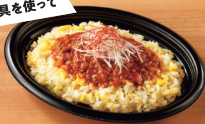
肉味噌チャーハン