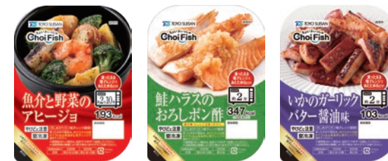
魚介と野菜のアヒージョ

「ちよいと手軽に本格的な魚料理を楽しんでいただきたい」をコンセプトにした、魚自体のおいしさを活かした惣菜調理商品です。凍ったまま電子レンジで温めるだけでお召し上がりいただけます。貴重なたんぱく源としての水産物のおいしさにこだわりました。