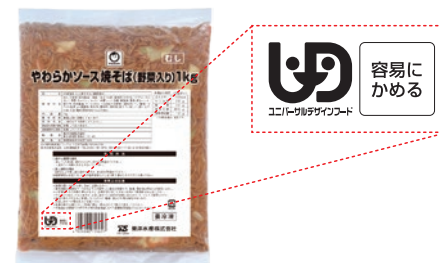
やわらかソース焼そば(野菜入り)

嚥下能力の低下した高齢者を対象に、飲み込みやすい麺と野菜が特徴の業務用の冷凍焼そばを開発し、2022年3月に発売しました。2023年2月製造分より、日本介護食品協議会が策定した嚥下機能を考慮した表示である、ユニバーサルデザインフード(UDF)の区分「容易にかめる」のマークをパッケージに表示しています。